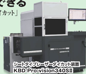
シートタイプレーザーダイカット装置 KBD Pro-vision340SII